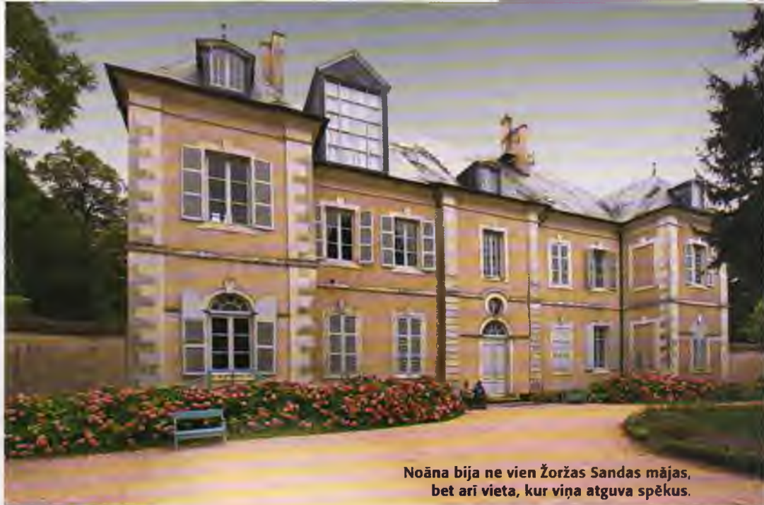
Noāna bija ne vien Žoržas Sandas mājas, bet arī vieta, kur viņa atguva spēkus.

Daži biogrāfi apgalvo, ka rakstniece bijusi arī poļu komponista Frederika Šopēna mūza un ar savu klātbūtni palīdzējusi viņam radīt daudzus skaņdarbus. Sākotnēji Šopēnam bijis